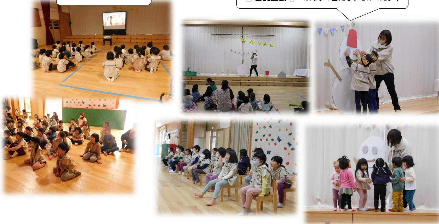
🎁雪誕生会 🎁 みんなで雪だるまを作ったよ!